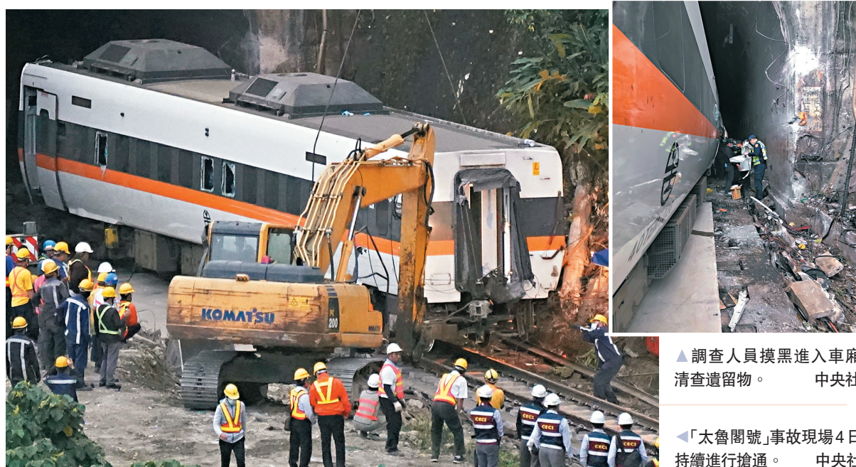
▲調查人員摸黑進入車廂清查遺留物。

香港文匯報訊(記者 蔣煌基 福建報道)台鐵「太魯閣號」出軌意外釀重大傷亡事故進入第三日。台灣運輸安全調查委員會(下稱「運安會」)4日表示,根據掌握的該輛列車行車記錄儀畫面判斷,肇事工程車早就橫在軌道上,「太魯閣號」煞車來不及才撞上,現在最重要的是調查工程車是怎麼滑下去,以及究竟有無煞車。據台媒報道,台「運安會」取得「太魯閣號」事故前影像,顯示列車駕駛看到軌道上的工程車時只有約250米距離,反應時間不到10秒。