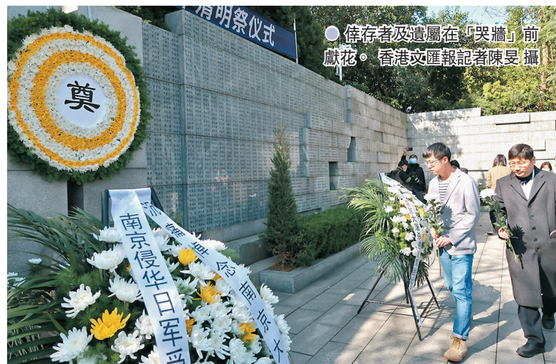
倖存者及遺屬在「哭牆」前獻花。