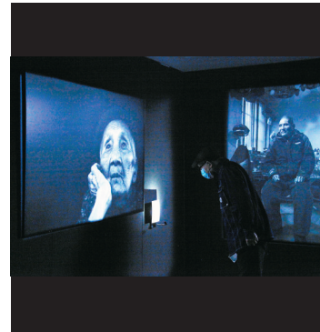
南京大屠殺倖存者藝術肖像攝影展4日開展。

自2016年起,紀念館邀請了連加加為部分倖存者拍攝藝術肖像照,5年裏先後拍攝了86位倖存者的照片。但就在這5年裏,這些老人中有17位離世。目前,在世的倖存者僅餘69人。