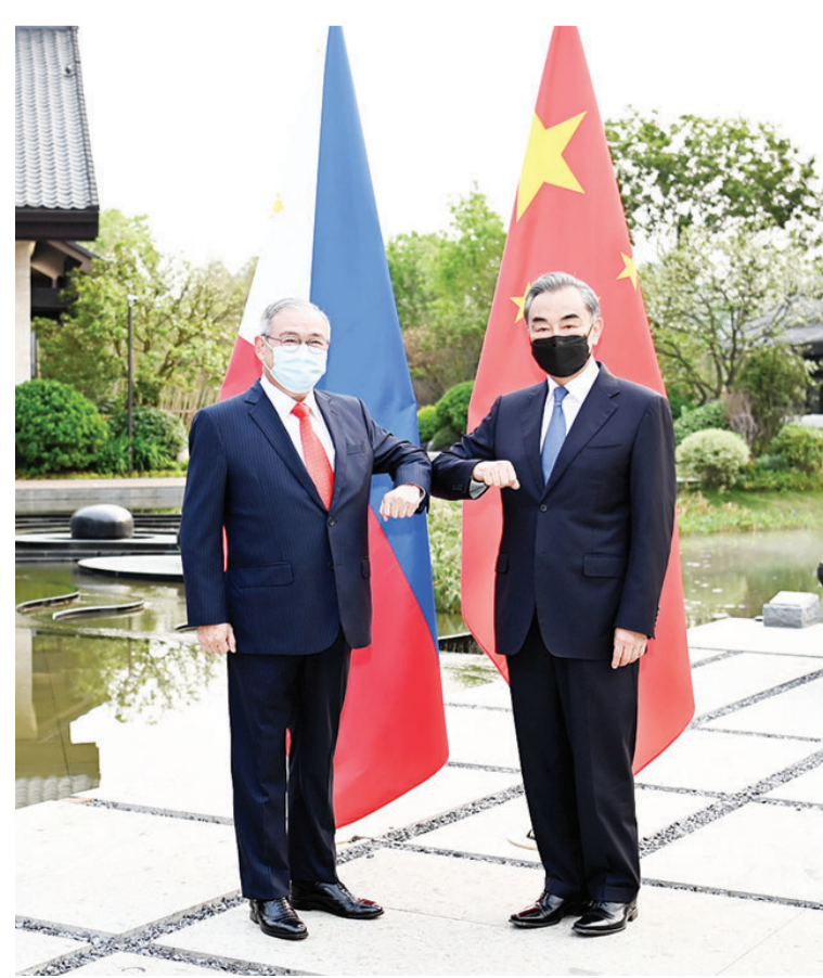
王毅与菲律宾外长洛钦

王毅：中韩互为永久近邻和战略合作伙伴。两国在维护地区稳定、推进共同发展、完善全球治理等方面有着广泛共同利益和相近理念，我们都主张开放、包容、合作、共赢，都致力于促进地区和世界发展繁荣。疫情发生以来，中韩率先开展联防联控，率先开通人员往来“快捷通道”，复工复产合作走在世界前列。这反映了中韩关系的高水平，体现了中韩友好的韧性和活力。明年是中韩建交30周年，两国关系面