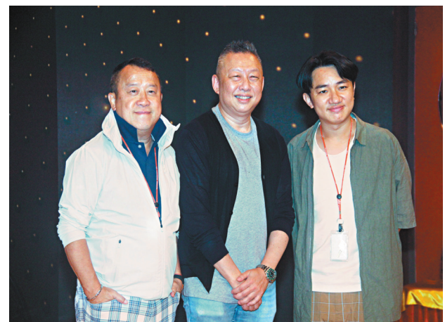
兩位TVB高層曾志偉(左)和王祖藍(右)前日也有現身。

香港文匯報訊(記者 達里)由賴慰玲、阮兆祥主持，汪明荃擔任主席評判的全新綜藝節目《好聲好戲》前日舉行拜神儀式，TVB高層曾志偉、王祖藍也有現身，節目請來嘉賓黃翠如、張振朗、朱敏瀚、鄧智堅、謝嘉怡玩配音遊戲，翠如與振朗均表示配音與演戲是截然不同的事情，藉此機會了解自己的不足。