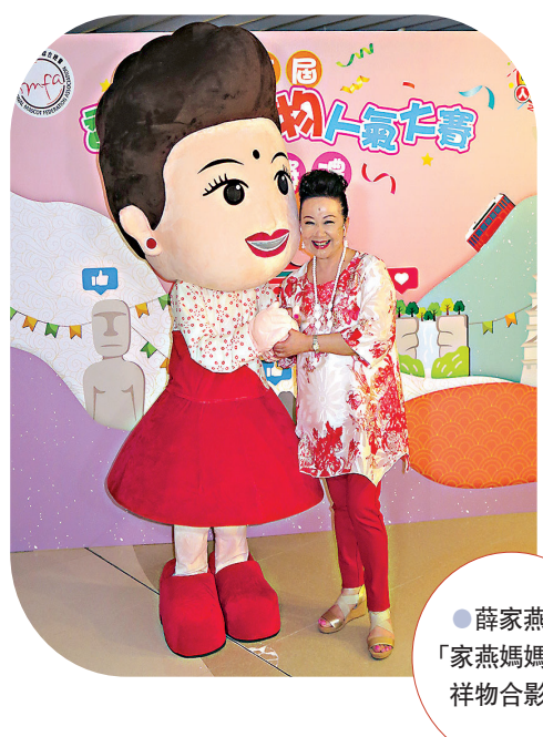
薛家燕與「家燕媽媽」吉祥物合照。

香港文匯報訊(記者 阿祖)薛家燕前日出席「吉祥物關愛參與社會教育推廣計劃啟動禮」，她更與「家燕媽媽」吉祥物合照。家燕姐表示獲大會邀請下將「家燕媽媽」塑造成為吉祥物，推動作為教育以及對市民作出關愛。笑問這個「家燕媽媽」吉祥物感覺是否很神似？她笑說：「幾似呀，都有粒墨！靚就差少少，真人梗係靚少少啦，眼神就有點不同。」