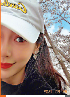
Angelababy在櫻花樹下留影。網上圖片