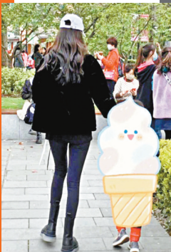
有網民晒照指偶遇Angelababy和小海綿。

香港文匯報訊 Angelababy(楊穎)近日錄製內地綜藝節目《奔跑吧》第九季，但趁着春暖花開的日子，她興之所至地去賞櫻花，更在微博上載自拍照，人靚景靚，賞心悅目，獲網民讚：「真是美好的一天啊！可謂是花美人更美！」而網民晒出近日偶遇Baby帶兒子「小海綿」賞花的照片，並大讚Baby本人身材超好，小海綿也很可愛。