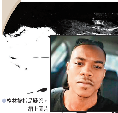
●格林被指是疑兇。

美國國會山莊繼今年1月發生暴動後，2日再次遇襲，一名疑犯駕車撞向國會外的路障及國會警察，下車後揮刀施襲，造成兩名警員一死一傷，疑犯被在場其他警員擊斃。當局初步調查顯示事件不涉恐襲，亦與1月暴動沒有直接關係。總統拜登已下令白宮降半旗致哀，並向殉職警員家屬致以慰問。