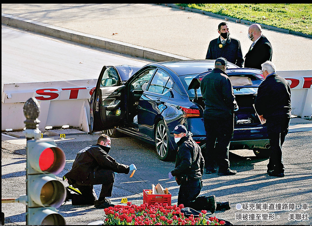
●疑兇駕車直撞路障，車頭被撞至變形。