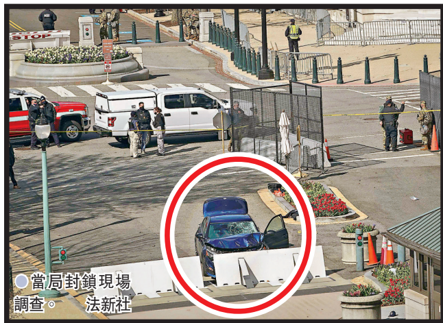
●當局封鎖現場調查。