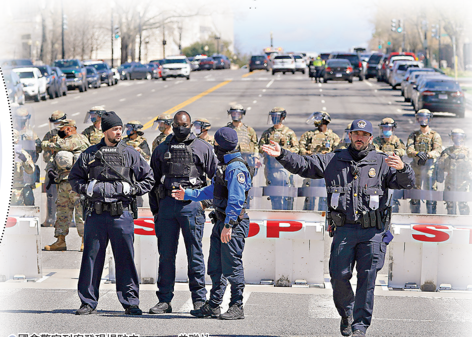
●國會警察到案發現場駐守。

退役美軍將領奧諾雷此前接受眾議院議長佩洛西委託，檢討國會等聯邦建築物的保安安排，他在報告中建議增派人手，並提升情報收集能力，全面加强保安。襲擊案發生後，奧諾雷重申國會山莊仍是極端主義暴徒的攻擊對象，呼籲國會嚴肅對待保安事宜。 ●綜合報道