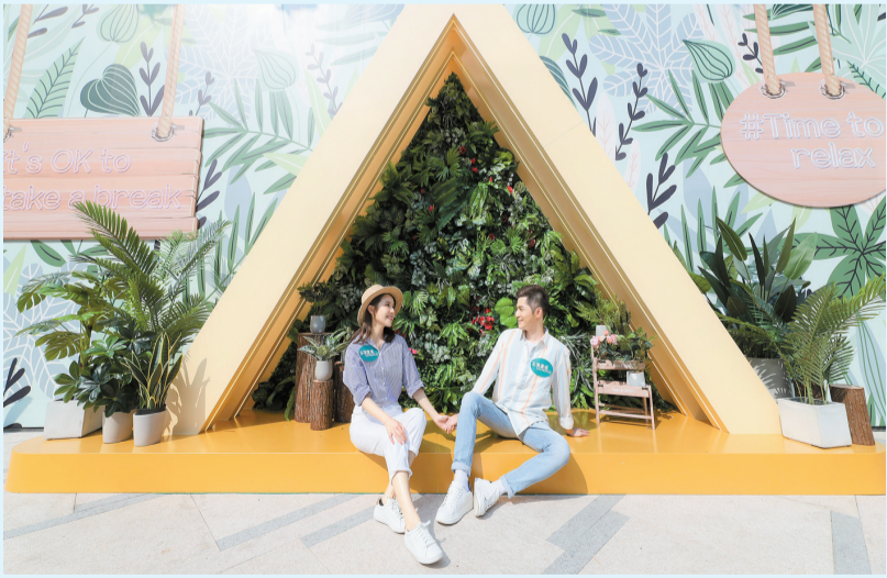
荃灣廣場聯乘本地園藝品牌 Greenology 打造綠藝空中花園。

【香港商報訊】今個復活節，新鴻基旗下荃灣廣場送上3大驚喜。爲迎接春天這個充滿活力的季節，荃灣廣場帶來都市中的Botanical Garden，令大眾感受植物自然風。即日起至5月31日，「荃灣廣場-共享綠藝空中花園」聯乘園藝高手Greenology將Botanical Garden融入日常生活中，創作6大休憩打卡場景，包括22米長的「綠藝打卡牆」、「部落小帳幕」、「度假風藤編小窩」、「Green Fingers鞦韆」等等，不同品種、形態的綠色植物設置於戶外平台花園，不用遠征郊區就可以享受自然氛圍。爲配合悠閒生活，即日起至4月6日迎來慢活市集，齊集20個小手作品牌，讓文青們搜羅生活好物：咖啡、花茶、手工皂、香薰、押花飾物，增添生活趣味。另外，4月更舉行「多買多賞」餐飲購物優惠，大派15000張優惠券。