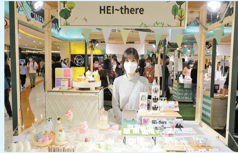
荃灣廣場一樓中庭的「慢活市集」，雲集20個文青品牌。

疫情的「副作用」令不少香港人體會到親近自然的好處，綠色植物除了擔任「天然空氣清新機」的