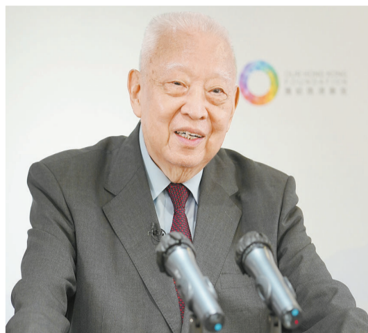
董建華指出，落實「愛國者治港」原則能為香港打開新的人才局面。

【香港商報訊】記者馮仁樂報導：十三屆全國人大常委會第二十七次會議3月30日表決通過了新修訂的基本法附件一和附件二，對行政長官和立法會的產生辦法作出系統修改和完善，全國政協副主席董建華近日接受新華社專訪時表示，完善選舉制度能讓香港的議會運作和特區政府施政重回正軌，落實「愛國者治港」原則能為香港打開新的人才局面。他呼籲全港市民團結起來，同心同德，堅毅奮進，協力開拓香港由亂到治、由治到興的黃金時代。