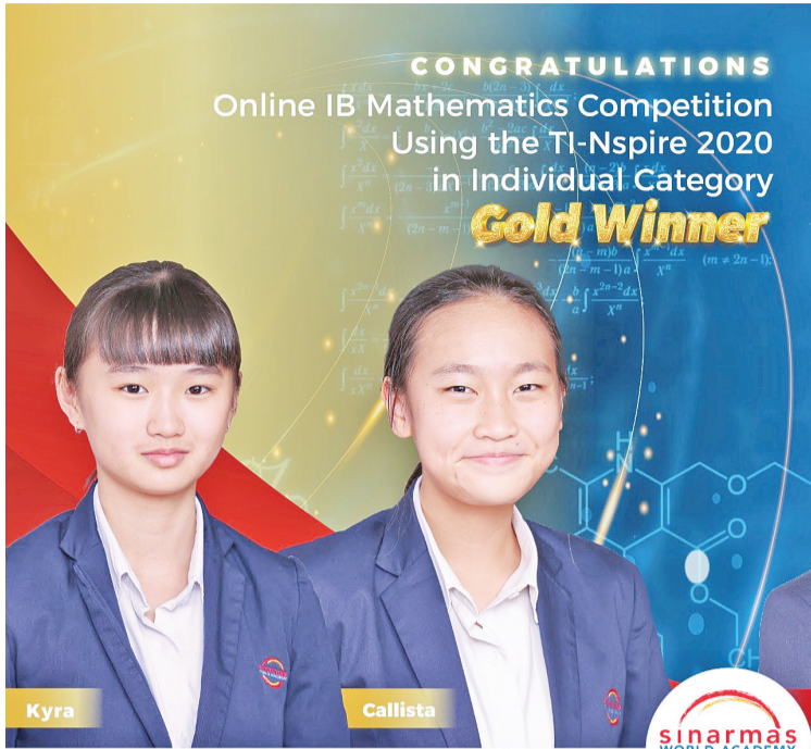
Embracing the Future, Embracing Asia