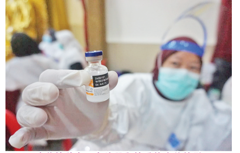
疫苗接种者正在注册和接受检查的情形

克服这大流行疫情。雅加达首都专区政府不仅动员省政府内部人员，而且还为支持疫苗接种活动提供医院和祈祷场所，也包括寺庙。目前政府不断加强对所有印尼民众进行新冠疫苗接种。