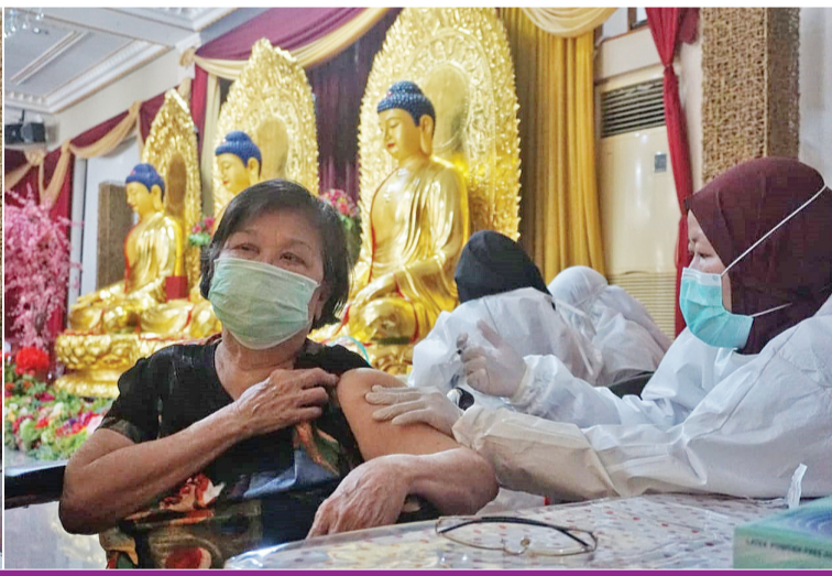
工作人员正在给老年人注射新冠疫苗