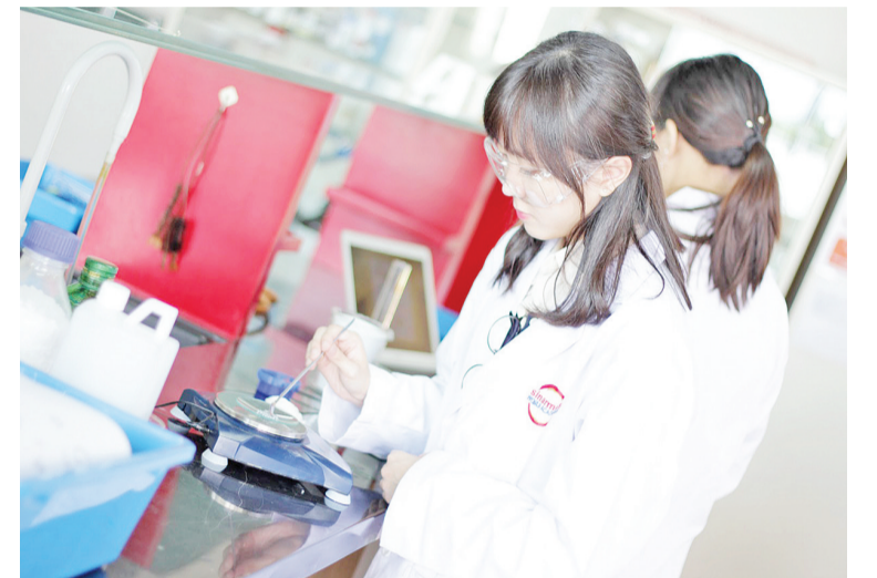
女生活动在STEM科技领域

根据联合国教科文组织在《STEM中的女孩和妇女的教育》中的报告，教育系统和学校在确定女孩对STEM的兴趣方面起着重要作用。教师和整个学习环境对于确保女孩参与STEM至关重要，而STEM女教师对学生的表现以及对STEM研究和职业的