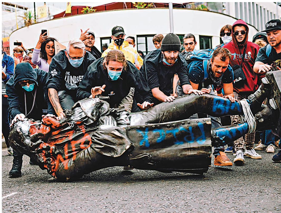
●委員會在報告中建議，應讓學童了解有關黑奴貿易的「新故事」。圖為去年示威者拆毀涉及黑奴貿易的雕像。