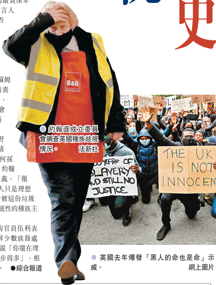
●約翰遜成立委員會調查英國種族歧視情況。法新社

英國首相府專責處理種族平等的前官員伍利表示，報告反映英國政府不但沒有了解少數族裔處境，甚至認為他們不應抱怨，如同在說「你還在埋怨什麼？我們的社會已較100年前進步得多」，根本沒有尊重曾遭種族歧視的受害者。 ●綜合報道