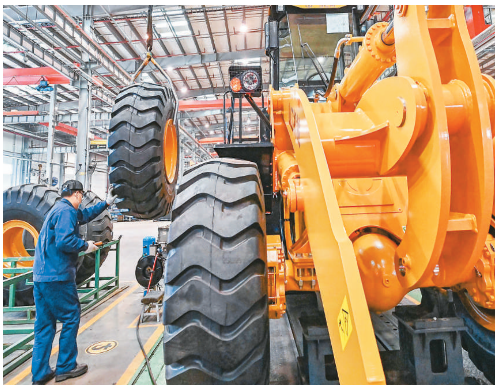
3月31日，国家统计局服务业调查中心、中国物流与采购联合会发布的数据显示，3月份，中国制造业采购经理指数（PMI）为51.9%，高于上月1.3个百分点，制造业景气回升。图为3月31日，工人在山东省青州市一家装备制造企业车间内生产作业。