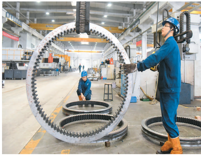
安徽省马鞍山经济技术开发区发展新能源及节能环保产业，助力企业转型升级和高质量发展。图为4月1日，马鞍山方圆精密机械有限公司员工在加工多款为风电、医疗等行业“量身定制”的回转支承产品。