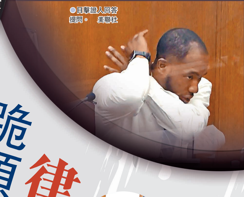
●目擊證人回答提問。