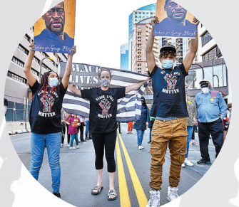
●美國民眾努力爭取種族平權。