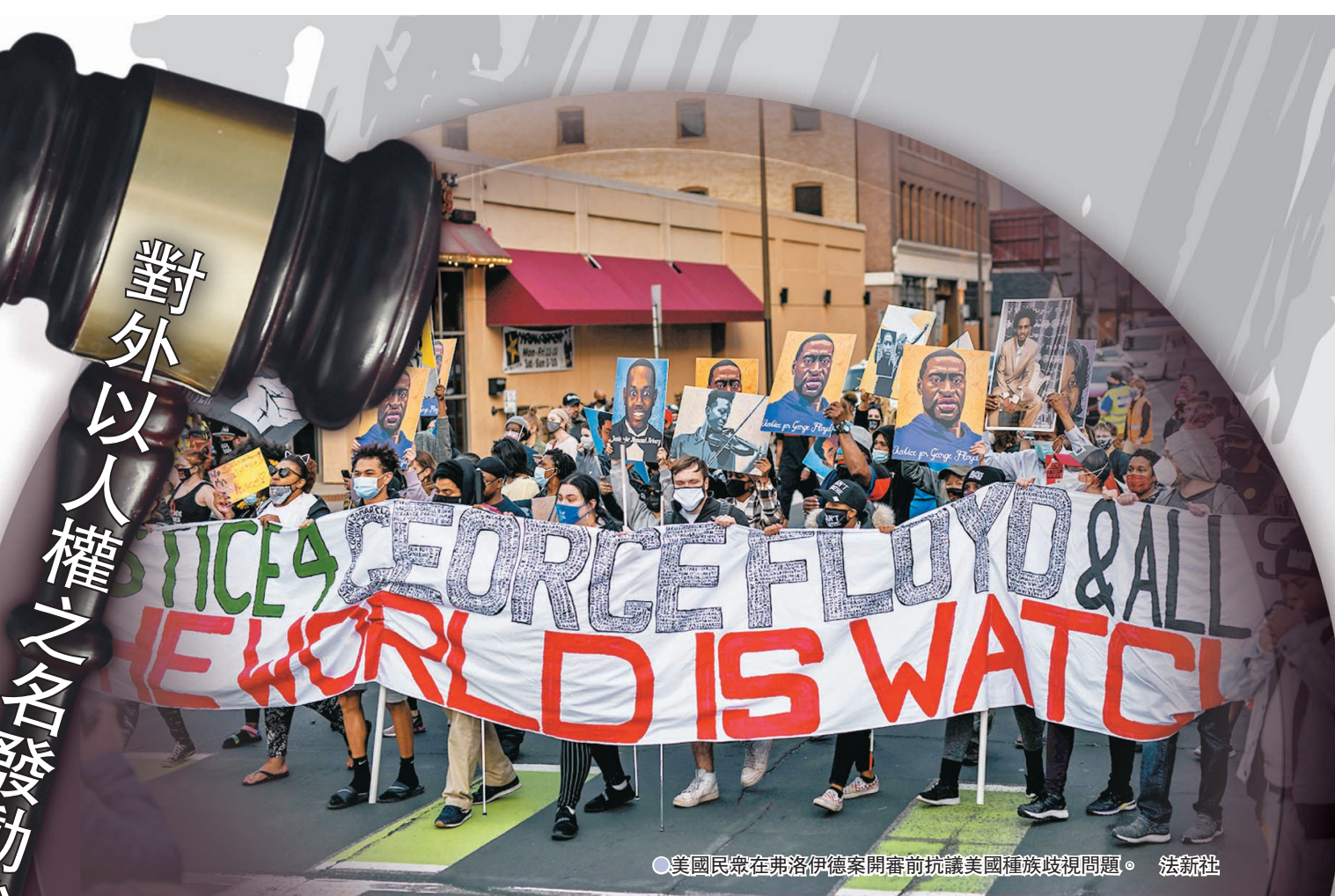
●美國民眾在弗洛伊德案開審前抗議美國種族歧視問題。