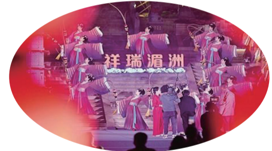
“祥瑞湄洲”精彩上演。