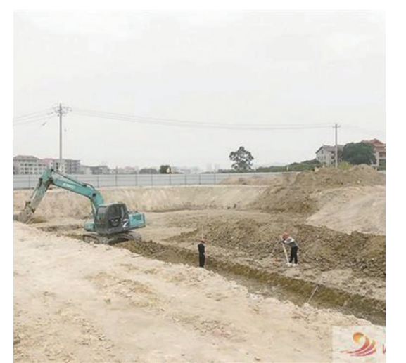
鑫瑞科技新型功能材料產業鏈項目現場。

今年，仙游繼續圍繞“東拓南進西擴北興中修”城市發展戰略，堅持城鄉統籌、新城建設與舊城更新并重，突出中心城區與濱海新城“雙城聯動”。