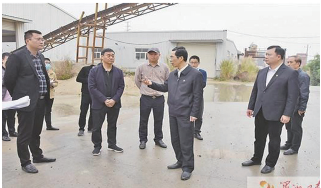
仙游縣委、縣政府領導調研鞋服標準化廠房建設項目。

“再學習、再調研、再落實”活動開展以來，仙游縣注重與落實“五促一保一防一控”要求，實施“雙輪”驅動，推動“雙園帶動”“雙城聯動”“鄉村振興”等重點工作有機結合起來，明確了6月上旬在全市“三看兩評”考評中保二爭一的目標任務和5月前完成“3個100%”的時間節點，以此倒排時間表，奮力作為，努力實現“十四五”良好開局。