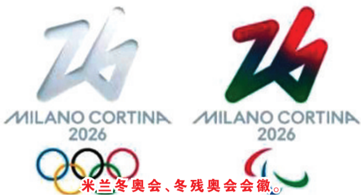
米兰冬奥会、冬残奥会会徽。

中新网客户端3月31日电 据国际奥委会网站及国际残奥委会网站消息,日前,2026年米兰冬奥会和残奥会的官方会徽正式发布。