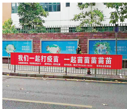
●火上熱搜的深圳鹽田區接種疫苗標語。

據深圳市衛健委透露，全市開展新冠疫苗全員接種，深圳市屬醫院也作出積極響應，迅速組建了4,500多名市級支援醫療隊，根據各區新冠病毒疫苗接種的醫療保障需求，分期分批支援各區開展新冠病毒疫苗接種工作。