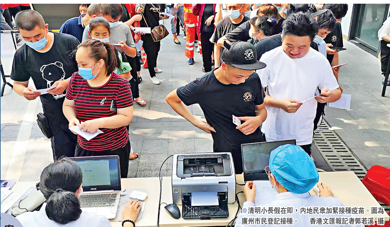
●清明小長假在即，內地民眾加緊接種疫苗。圖為廣州市民登記接種。