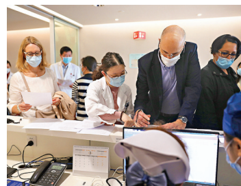
●上海全面啟動在滬外籍人士新冠疫苗預約接種。

上海市疾控中心發布的信息顯示，上海目前使用的是國產新冠病毒滅活疫苗，全程需接種兩劑。已參加上海市社會保障醫療保險的外籍人士，享