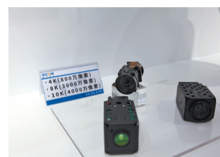
福光股份镜头产品。

“十四五”期间,将突出创新能力建设,推进产业基础高级化、产业链现代化。坚持创新在现代化建设全局中的核心地位,完善制造业创新体系,推进制造业创新中心试点,力争到2025年,福州市新认定企业技术中心50家以上。支持企业加大研发投入,推进产业基础再造,实施一批重大产业创新项目,加强关键核心技术攻关,补齐产业链供应链短板。实施“数字·绿色”技术改造专项行动,加快创新技术在制造业中深度应用,跟踪推进一批重点技术改造项目,加快制造业转型升级。加强新业态培育壮大,加快新一代信息技术、新能源汽车、化工新材料、海上风电装备等战略性新兴产业发展,建设晋安湖、东湖、旗山湖“三创园”,打造一批先进制造业产业集群。力争到2025年,福州市规模以上工业战略性新兴产业增加值占规模以上工业增加值比重超过35%。