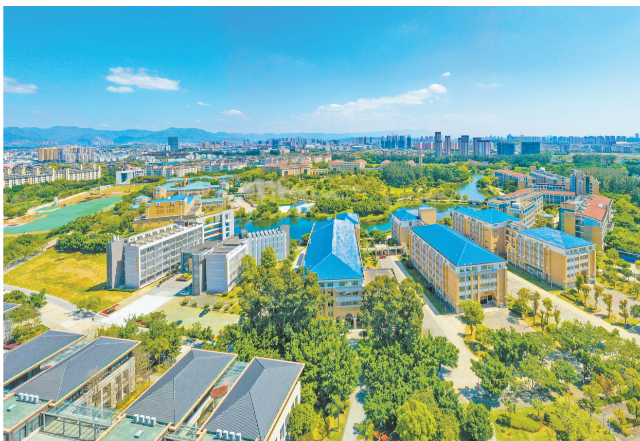
俯瞰闽江学院。

3月24日-25日,习近平总书记先后来到福山郊野公园、三坊七巷历史文化街区、福建福光股份有限公司、闽江学院,就贯彻中国共产党十九届五中全会精神、推动“十四五”开好局起好步、统筹推进常态化疫情防控和经济社会发展等进行调研。编者对习近平总书记福州考察调研讲话金句进行了梳理,并就如何贯彻落实习近平总书记重要讲话精神采访了有关部门和学校。