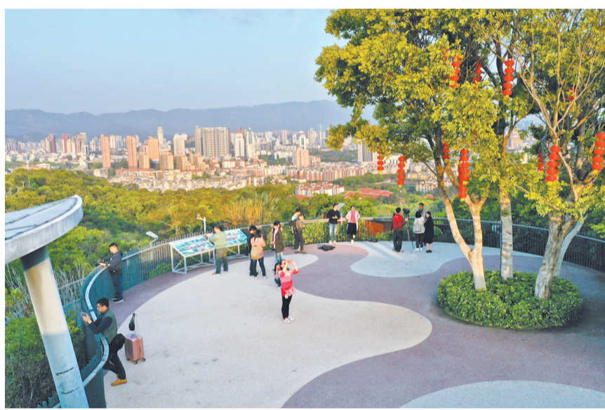
福山郊野公园新福台。

福州市自然资源与规划局局长吴建青说,近年来,福州市委、福州市政府着力画好“山水画”,保护山水格局,充分利用自然资源优势,在全市各县(市)区统筹规划建设环山步道130多公里、滨水绿道600多公里、生态公园15个,让福州市民“推窗见绿、出门进园”。“习总书记在福州考察调研期间,对福州城市规划建设给予了充分肯定,这是对我们工作的莫大鼓舞和激励。”吴建青表示,将牢记习总书记殷切嘱托,科学规划绿色发展空间,持续推动绿环、