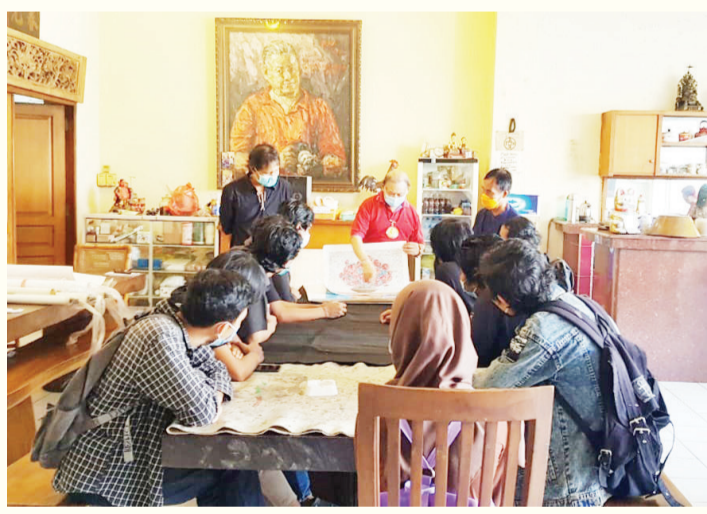
巴厘宣纸协会讲解宣纸作画技巧和要点

【本报讯】驻登巴萨记者叶露综合报道：3月29日（周一），巴厘宣纸协会和巴厘艺术俱乐部在Kerobokan咖啡画廊共同举办以“Gajah Mina”为