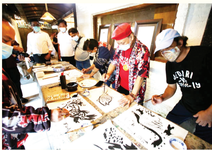
各艺术家在宣纸上进行即兴创作