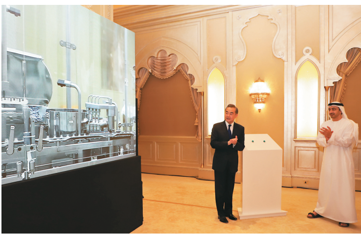
灣地區疫苗生產和轉運樞紐，支持更多國家抗擊疫情。

會談後，雙方共同出席兩國疫苗原液灌裝生產線項目「雲啟動」儀式。阿卜杜拉表示，中國企業在阿開展全球首個新冠滅活疫苗三期國際臨床試驗，體現了兩國的高度互信，國際社會對此充分肯定。迄今已有120多個國籍、共5萬多名志願者參與試驗。試驗結果表明，中國疫苗安全有效，並正在得到國際社會的認可。阿方願同中方深化疫苗合作，下一步通過啟動灌裝中國疫苗原液項目，將阿打造成為海