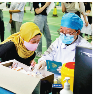
● 3月28日，華僑大學外國留學生準備接種新冠疫苗。

3月27日至28日，華僑大學組織廈門校區包括外國留學生在內的師生員工，在「知情、自願、免費」的原則下接種新冠疫苗。