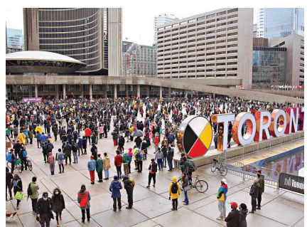
● 3月28日，來自不同族裔社區的數千人在加拿大多倫多市政廳前廣場參與集會示威，反對種族主義、呼籲停止仇視亞裔。

香港文匯報訊 據中新社報道，「亞裔不是啞裔！」多倫多、溫哥華、渥太華、維多利亞、卡爾加里、奧肯那根等加拿大個個城市於3月28日舉行反對歧視亞裔的遊行、集會示威