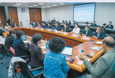
● 新疆維吾爾自治區人民政府，新疆教培結業學員代表，宗教界人士，新疆教育界、婦女界等代表向中外記者介紹了新疆在各領域的發展情況。