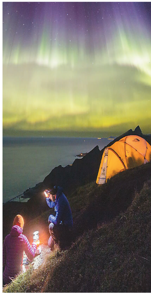
极光降临挪威罗弗敦群岛雷纳村。