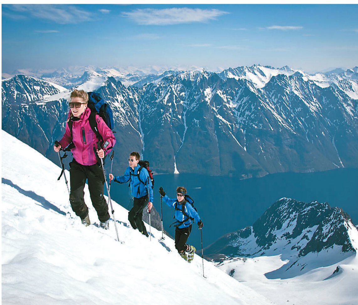
登山爱好者登顶挪威峡湾。