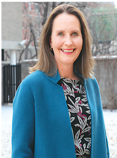
挪威驻华大使白思娜近照。