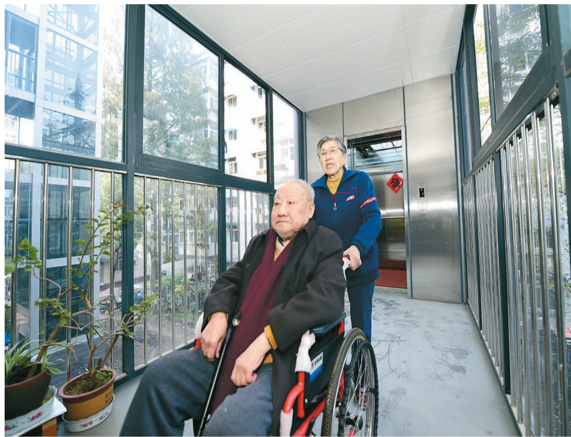
2020年11月19日，在安徽省合肥市庐阳区三孝口街道西平门社区，一对老年夫妇推着轮椅从电梯里走出。