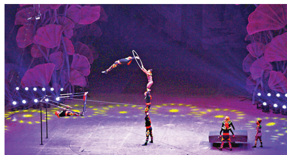
《撫仙湖傳奇》以「生命與自然的和諧共生」為主題。

演出地撫仙湖國際馬戲大劇院，是雲南寒武紀小鎮歡樂大世界的重要組成部分。馬戲大劇院可容納超過7,500名觀眾同時觀看。