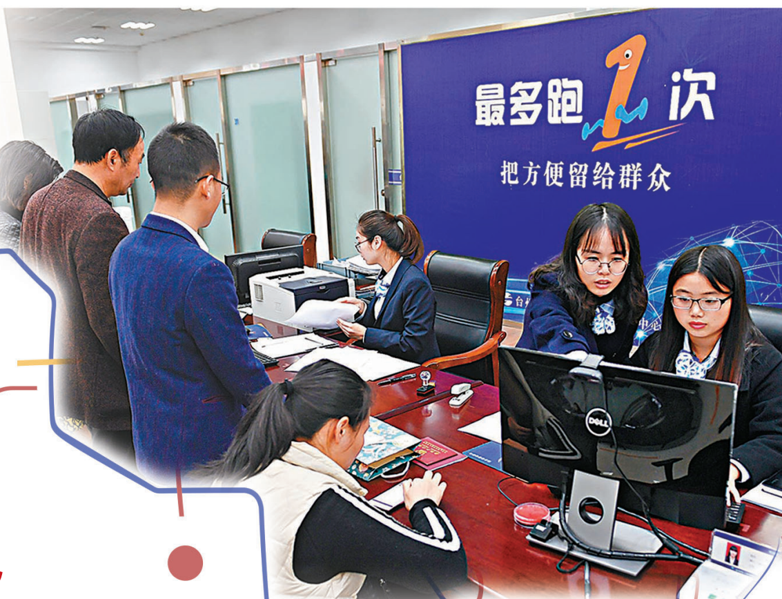
●今年政府工作報告提出，要提高「數字政府」建設水平。多位全國人大代表、政協委員表示，要切實落地「掌上辦」「一次辦」等舉措。圖為早年浙江省台州市行政服務中心的工作人員在給市民辦理業務。