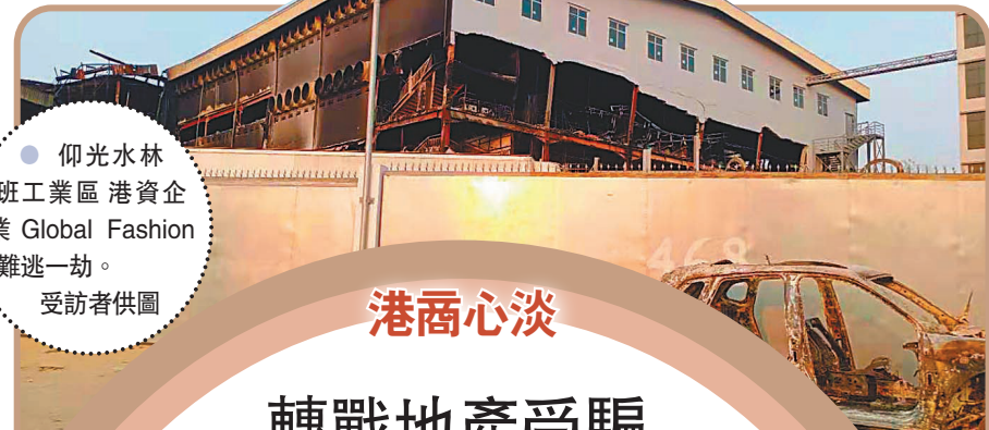
● 仰光水林班工業區港資企業 Global Fashion 難逃一劫。