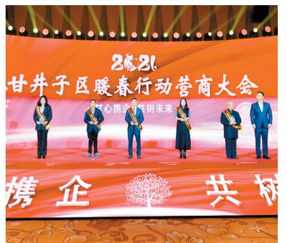
2021暖春行動營商大會現場

【香港商報訊】記者王麗藍報道：在3月25日舉行的「2021暖春行動營商大會」上，遼寧大連市甘井子區拿出億元獎勵企業創新創業，惠及387家企業和4家平台，營造崇尚創新、鼓勵創業、尊重企業家價值的良好營商環境。