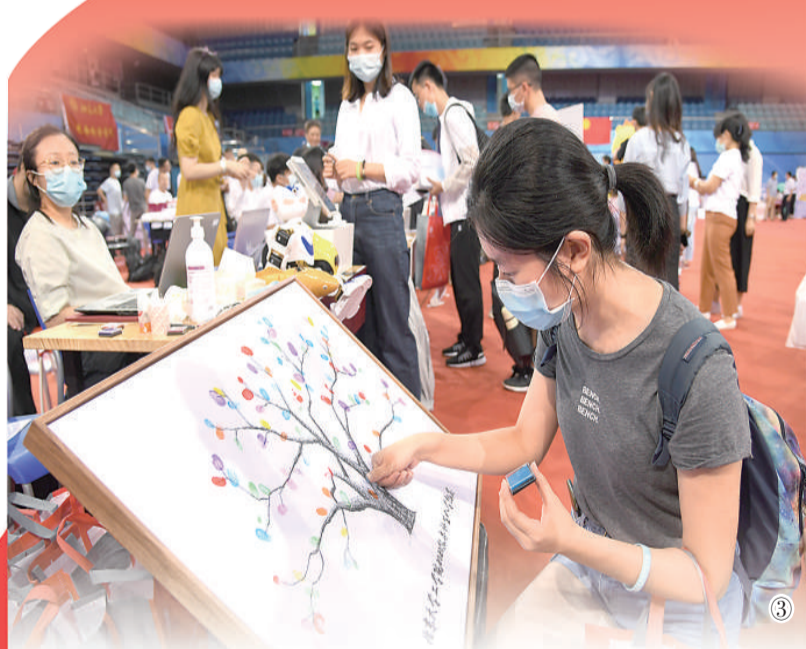
图①：哈尔滨工业大学超精密仪器技术创新团队。 图②：南京大学“985工程”——“物质科学平台”项目团队。 图③：2020年9月1日，一名北京大学新生在入学纪念画上按彩色手印。 图④：2020年9月9日，清华大学本科生开学典礼现场。