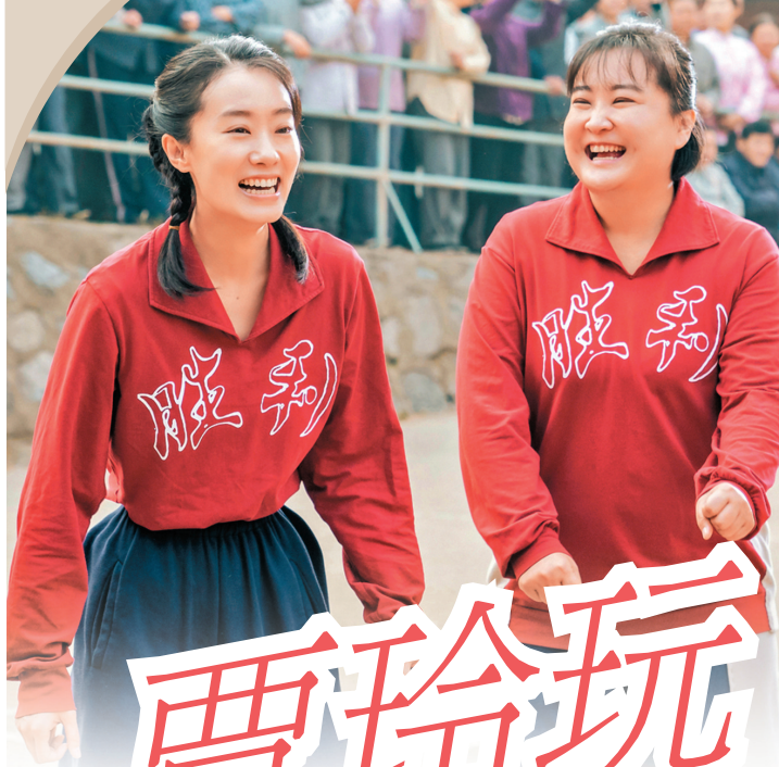
● 張小斐跟賈玲(右)玩女排奪冠元素。