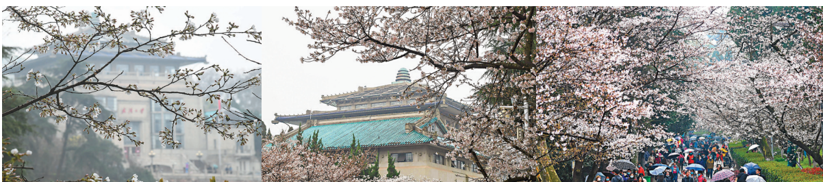
● 在武漢大學拍攝的櫻花