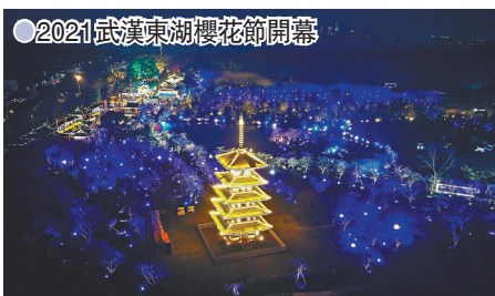
● 2021武漢東湖櫻花節開幕

花、日本櫻花和垂絲海棠競相開放，紅白相映，燦若霞海，落英繽紛，恍若仙境。昆明市民有這樣的說法：「賞櫻花根本不必到日本，到圓通山就行。」