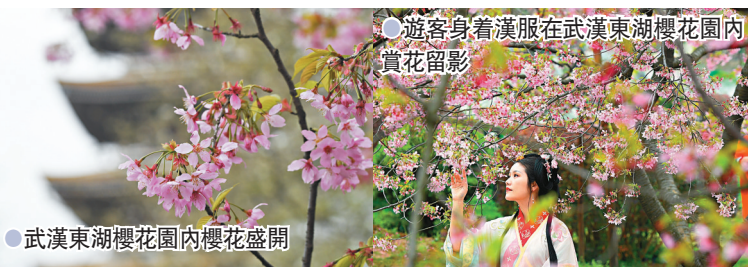
● 武漢東湖櫻花園內櫻花盛開