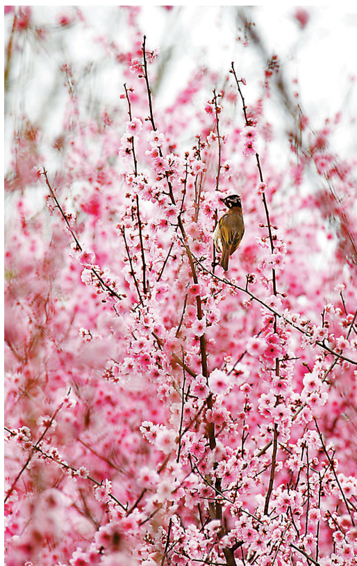
● 一隻小鳥在美人梅枝頭棲息。

枝頭棲息，一片和諧。位於河南省南陽市中心城區仲景路、濱河路、中州路及城市支路相圍合的區域的梅城公園，日前也是梅花綻放，遊客駐足觀賞。梅城公園分為「梅城遺蹟區」和「曲藝健身區」兩部分，是一個以展現歷史文化、體育文化為主題，集生態、休閒、健身、娛樂為一體的綜合性公園。