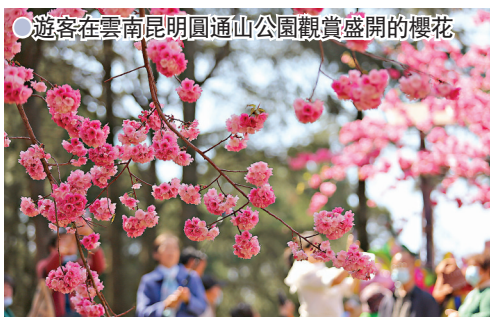
● 遊客在雲南昆明圓通山公園觀賞盛開的櫻花

設立抗疫醫護賞櫻綠色通道，援鄂醫護人員及省內抗疫醫護人員均可通過學校指定的網絡綠色通道登記後，經核驗進校賞櫻。武漢還於3月13日和3月14日設立兩天抗疫醫護賞櫻專場日，邀請援鄂醫療隊及湖北省內抗疫醫護人員來校賞櫻，在此期間不接受其他社會公眾預約。另外，雲南省昆明市的圓通山公園，每當陽春3月就有圓通櫻潮，園內上下三塊櫻花區裏，數千株雲南櫻