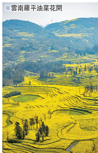
● 雲南羅平油菜花開