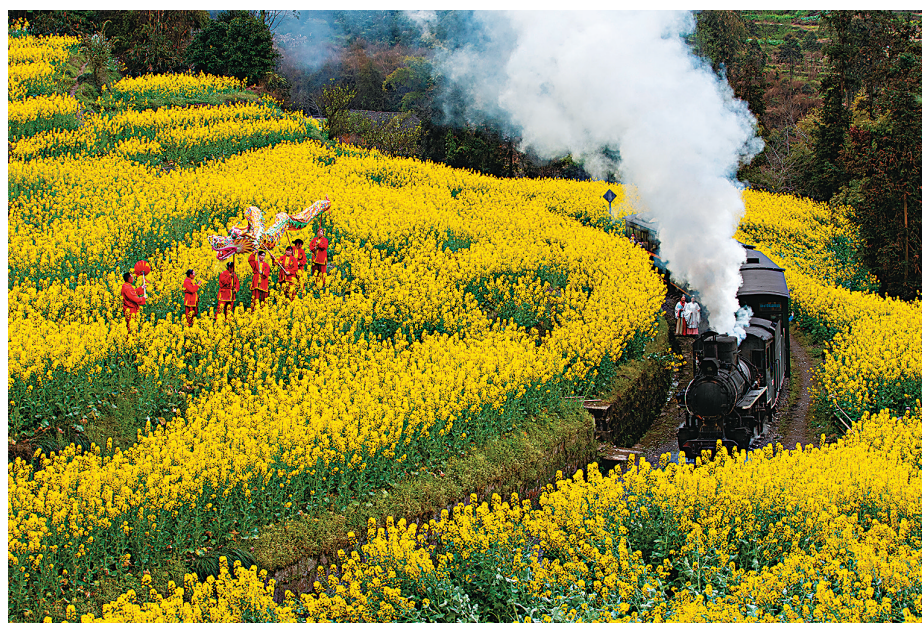
● 一列嘉陽小火車經過段家灣蜜蜂岩的油菜花海。

四川省犍為縣的嘉陽小火車旅遊迎來旺季，眾多遊客慕名前來乘坐這列開往春天的「小火車」，沿途觀賞風景，體驗老式窄軌蒸汽火車的獨特魅力，隨小火車穿過段家灣蜜蜂岩的油菜花海。而在其鄰省，雲南省曲靖市羅平縣的油菜花亦相繼開放，景色秀美，蜜蜂更在盛開的油菜花旁飛舞，非常熱鬧。