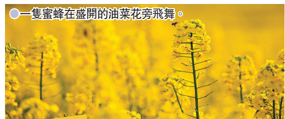
● 一隻蜜蜂在盛開的油菜花旁飛舞。