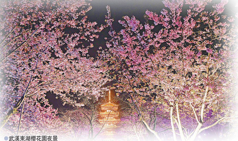
● 武漢東湖櫻花園夜景