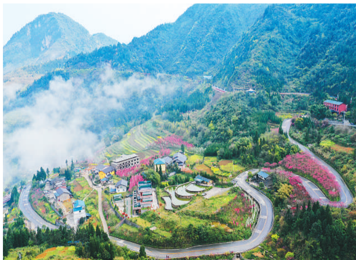
重庆市万盛经开区黑山镇南门外山村公路两侧，桃花盛开，晨雾、梯田、农家，宛如人间仙境。

每座城市都有一条“改变历史”的公路。300多处文化景点犹如珍珠一般，被一条乡村路串成一串，吸引无数游客前来观光。这是河北涉县的千里乡村路。因为这条路的串联，当地打通了旅游发展“大动脉”，红色