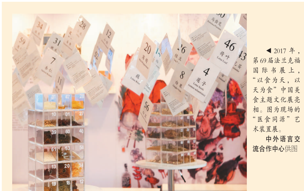
2017年，第69届法兰克福国际书展上，“以食为天，以天为食”中国美食主题文化展亮相。图为现场的“医食同源”艺术装置展。