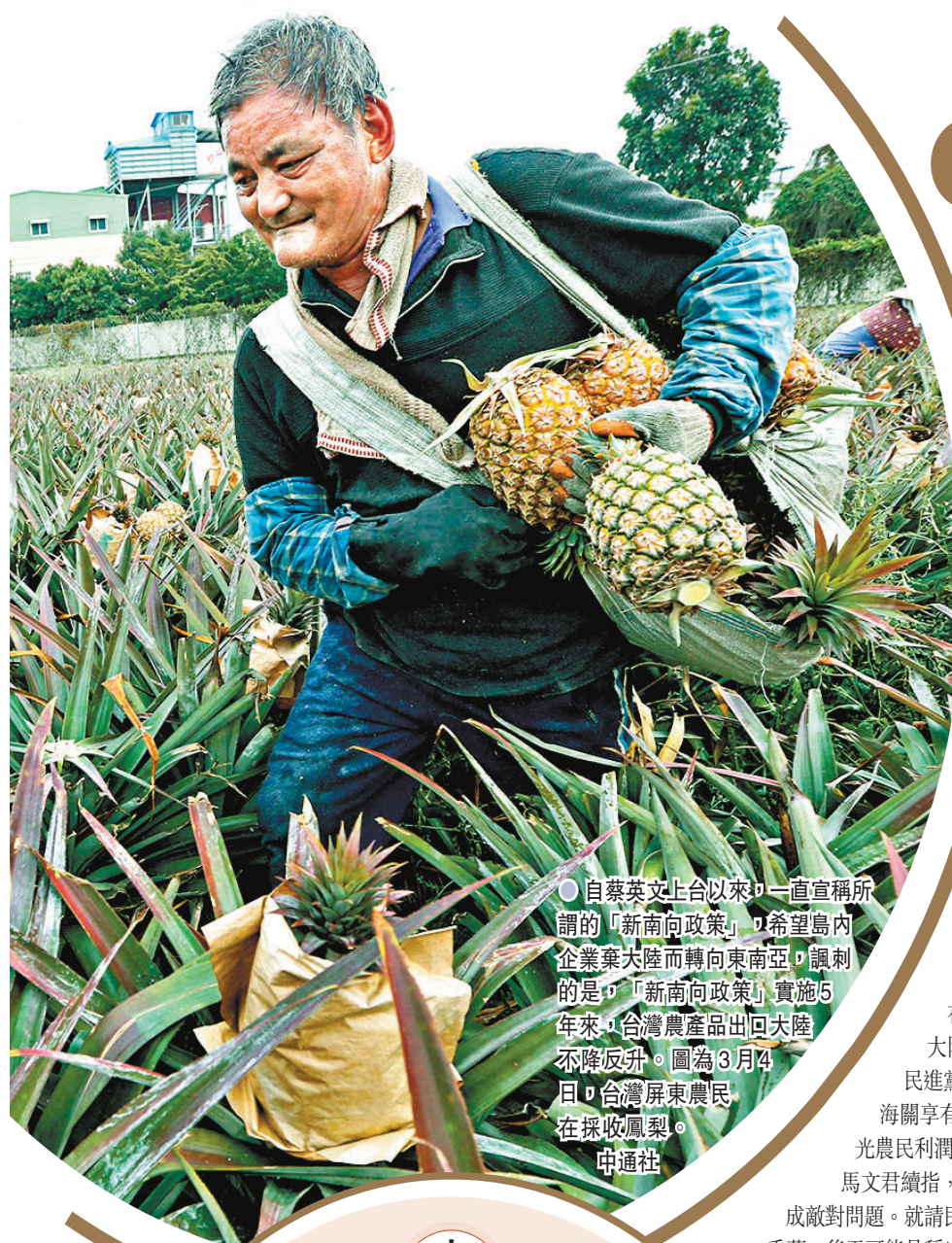
自蔡英文上台以來,一直宣稱所謂的「新南向政策」,希望島內企業棄大陸而轉向東南亞,諷刺的是,「新南向政策」實施5年來,台灣農產品出口大陸不降反升。圖為3月4日,台灣屏東農民在採收鳳梨。