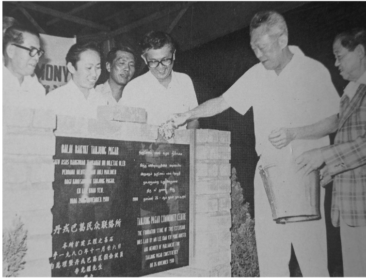
1980年11月26日，时任总理李光耀(右二)为丹戎巴葛联络所主持扩建奠基典礼。左二为林靖忠总执行理事长