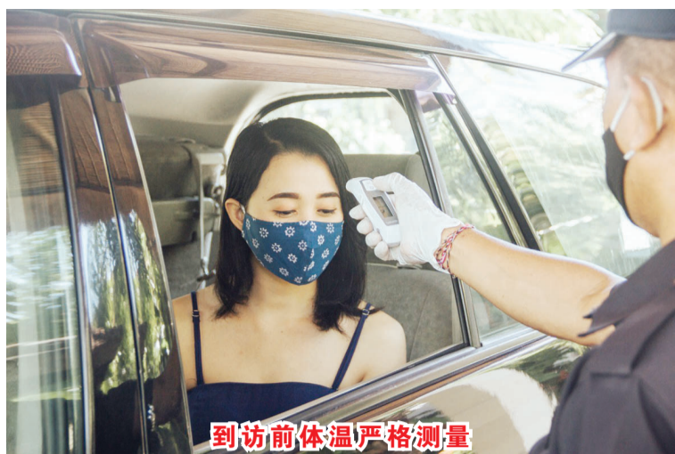
到访前体温严格测量