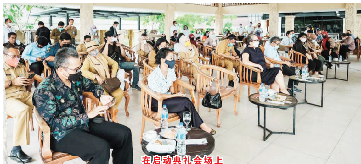
在启动仪式会场上