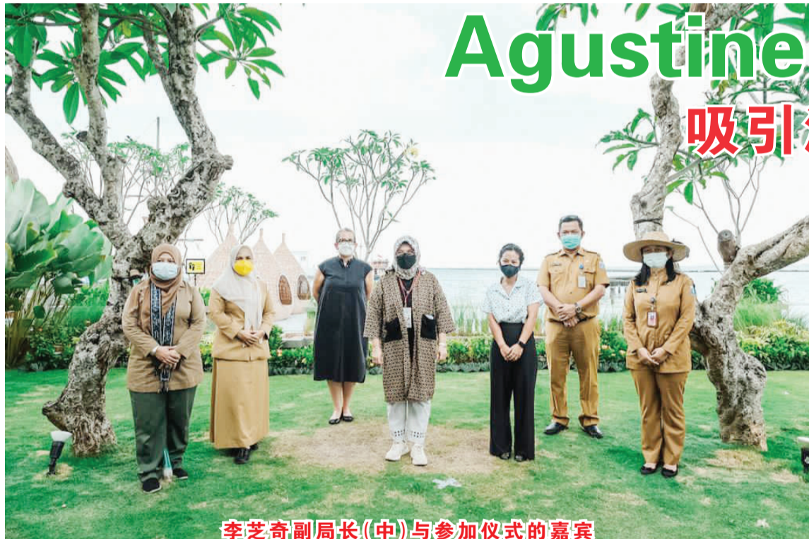
李芝奇副局长(中)与参加仪式的嘉宾