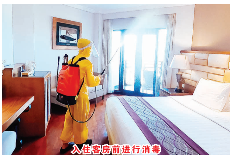
入住客房前进行消毒