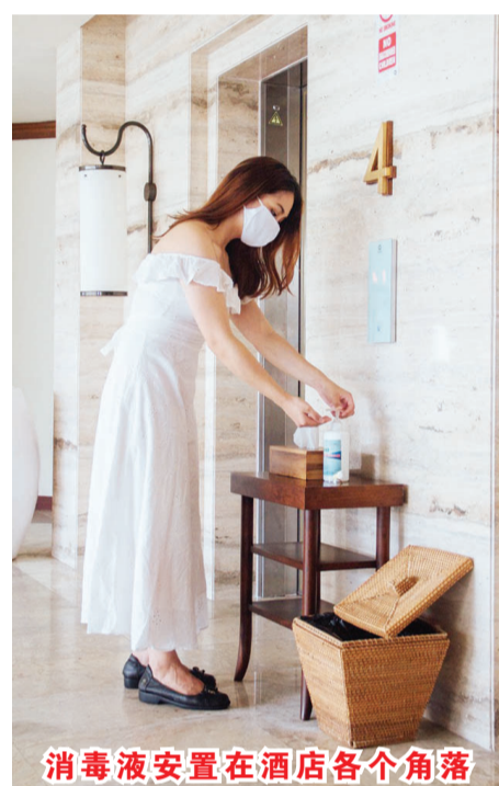
消毒液安置在酒店各个角落