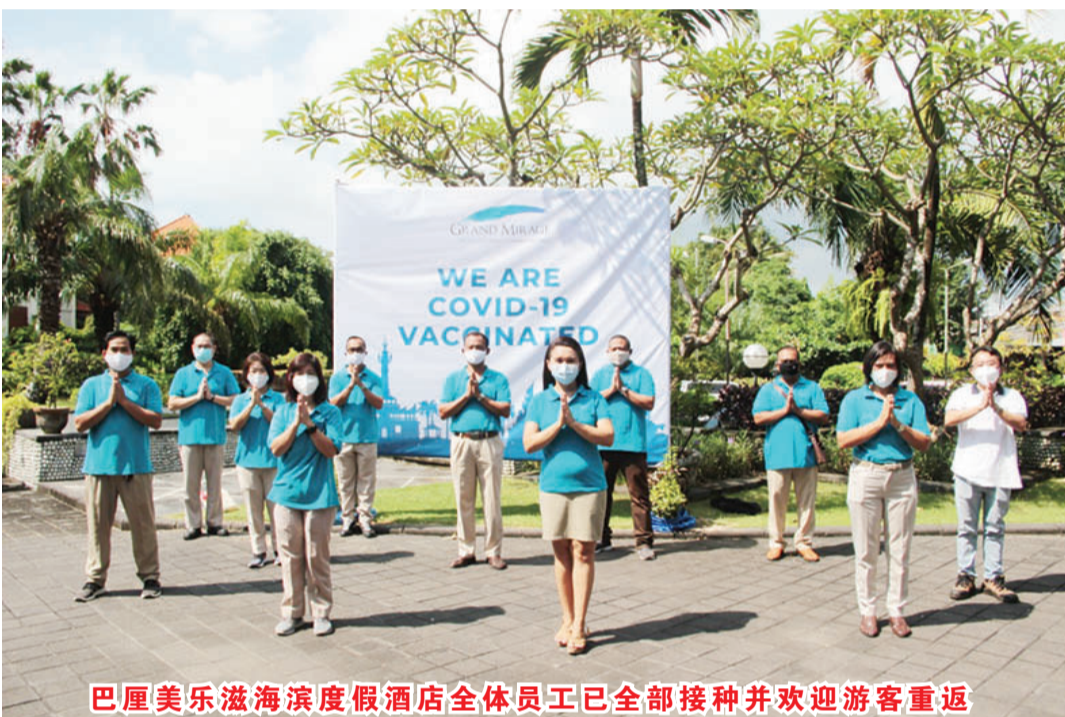
巴厘美乐滋海滨度假酒店全体员工已全部接种并欢迎游客重返