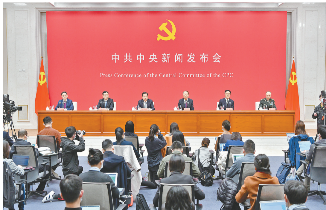
中共中央舉行年度首場新聞發布會，介紹中國共產黨成立100周年慶祝活動有關情況。

【香港商報訊】駐京記者張麗娟報道：中共中央昨日上午舉行年度首場新聞發布會，介紹中國共產黨成立100周年慶祝活動有關情況。立於中共百年華誕的歷史坐標之上，如何辦好這件「黨和國家政治生活中的大事」，引發外界高度關注。