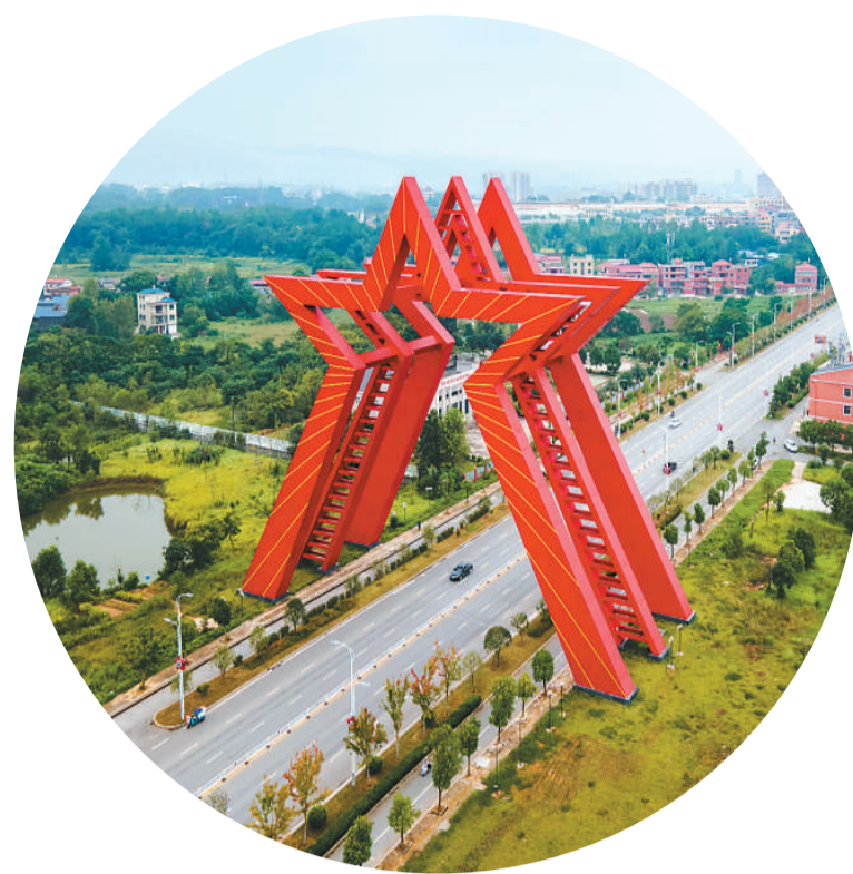
俯瞰江西省瑞金市五角星雕塑。

2009年，我追寻戊戌变法重要理论家陈炯故居。拐了几道山路，我们来到瑞市镇禾塘横背，经村人带路，找到陈炯故居和他出资兴建的“天马