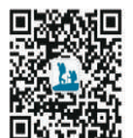
欢迎关注本版微信公众号“人民日报行天下”