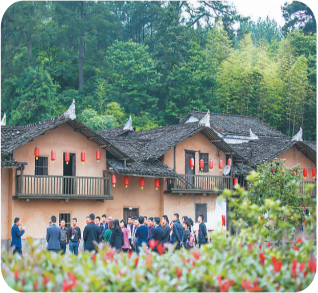
游客在瑞金市“红军村”华屋村参观。

春暖花开，贵州省黔南布依族苗族自治州贵定县盘江镇的油菜花田点亮了“金海”，山上的李子花飘起了“飞雪”。这幅人间仙境的美景，引来全国各地络绎不绝的游客。