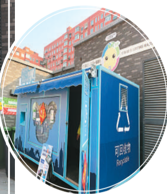
下图：位于劲松街道的“绿馨小屋”。

在最初的“绿馨小屋”，一个十几平方米的小房子放着不少可供循环阅读的书籍和宣传册，旁边还有由太阳能发电装置供电的电视机，不间断地播放讲解垃圾分类常识的宣传片。这个小房子同时承担了好几项任务，既是垃圾分类的宣传阵地，也是废旧物品的绿色回收站，还是厨余垃圾的收集基地。李震与团队成员们戴着绿色袖标，在这里跟一袋袋垃圾实实在在地进行着一次又一次“亲密接触”。