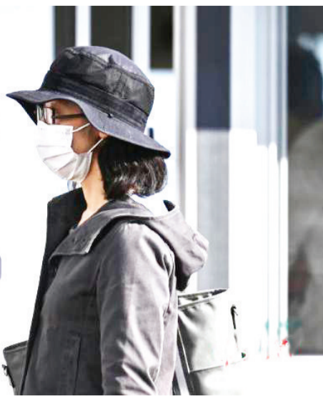
资料图:一名女士走过东京奥运会海报。