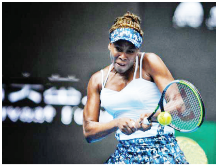
资料图:大威廉姆斯在比赛中。