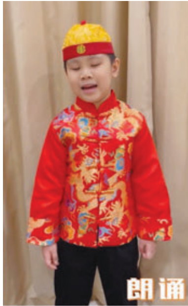
学生代表朗诵华语诗歌