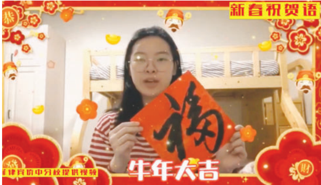
学生代表新春祝福