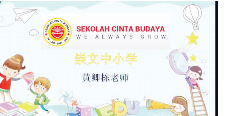
崇文黄卿栋老师分享教材使用经验