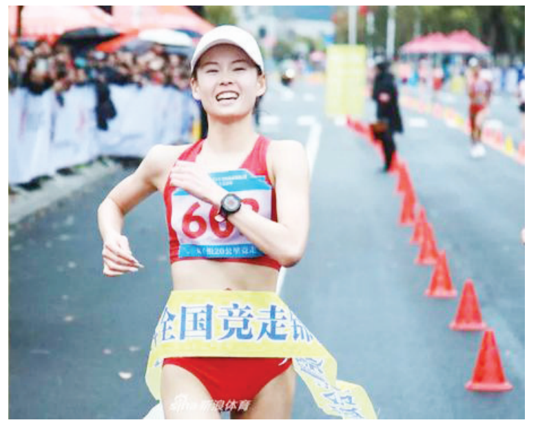
杨家玉夺冠并创造世界纪录

虽然对于奥运会如期举办的乐观情绪不断攀升,但防疫挑战依然严峻。世界很多国家和地区的确确诊病例依然居高不下,日本防止第四波疫情的压力也很大。东京都知事小池百合子和其他拥有奥运会场馆的千叶县、埼玉县的知事22日都发出警告,希望所有市民继续保持警惕,防止疫情反弹。4月10日,奥运会第一项测试赛水球比赛将开启,这次比赛不会有国际选手参加。对于奥组委真正的考验是4月23日开始的国际泳联世界杯跳水赛,这项比赛将成为奥运会比赛的预演。也就是说,到奥运会倒计时3个月时,人们将开始感受到东京奥运会的气氛。