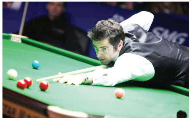
资料图:2014世界斯诺克上海大师赛拉开帷幕,奥沙利文在比赛中。

中新网3月23日电 北京时间23日凌晨,2021斯诺克巡回锦标赛揭幕战结束,奥沙利文10:8险胜希金斯,晋级半决赛。