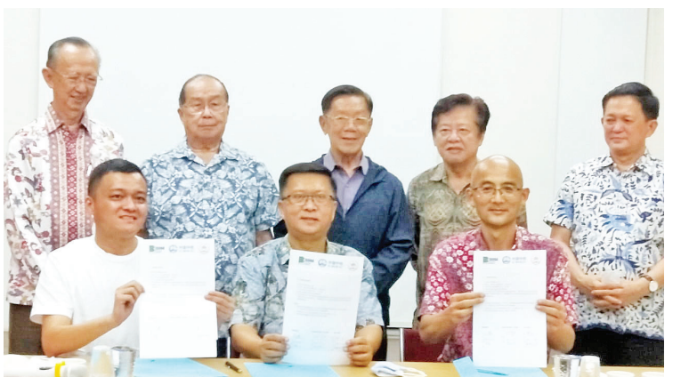
签署合作协议后合影