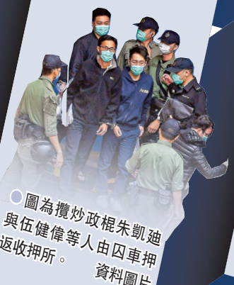
圖為攬炒政棍朱凱迪與伍健偉等人由囚車押返收押所。