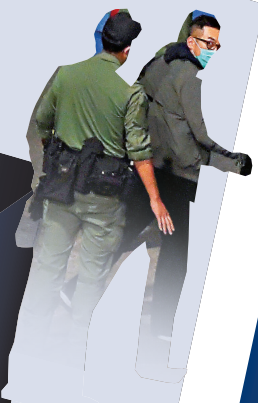
圖為攬炒政棍楊岳橋由囚車押返收押所。