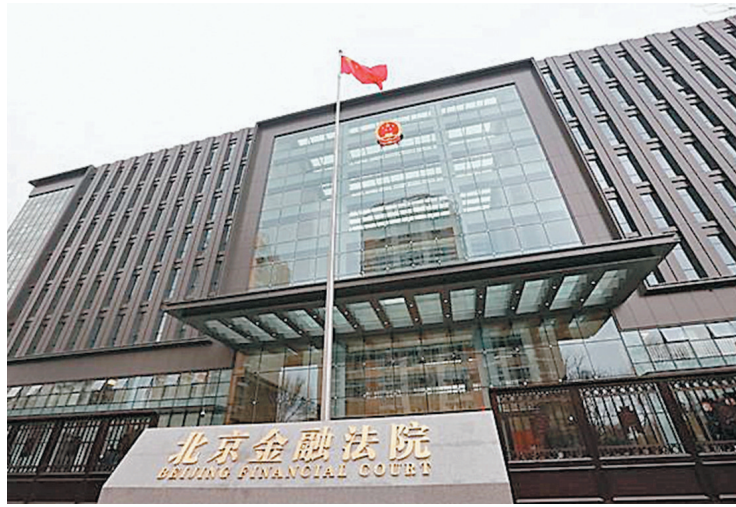
●北京金融法院正式掛牌成立。

香港文匯報記者了解到,根據《北京法院網上立案工作辦法》,金融民商事案件、執行實施案件可以通過登錄北京法院審判信息網或北京移動微法院的網上立案系統進行網上立案,當事人足不出戶就可以完成立案。同時,凡是通過網上方式立案的案件,當事人在後續審理執行過程中,都不需要重複向法院提交紙質版起訴材料,真正實現全流程網上辦案,服務優化營商環境。