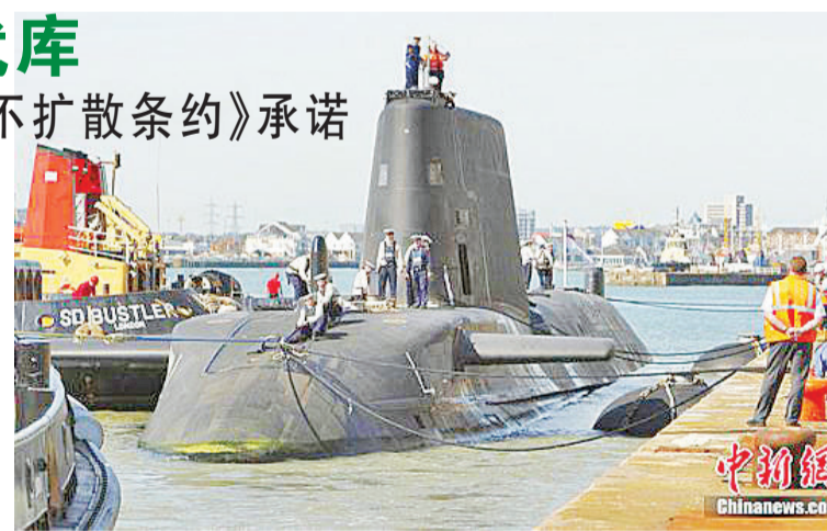
资料图:英国皇家海军核动力潜艇“机敏号”。