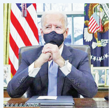
图为美国总统拜登

中新网3月19日电 综合报道,美国情报部门16日发布一份报告称,俄罗斯对2020年美国大选进行了干预。之后,美国总统拜登指责俄罗斯总统普京是“凶手”。俄罗斯迅速召回驻美大使以讨论俄美关系前景,总统普京也对拜登言论进行回应并希望与其展开对话。