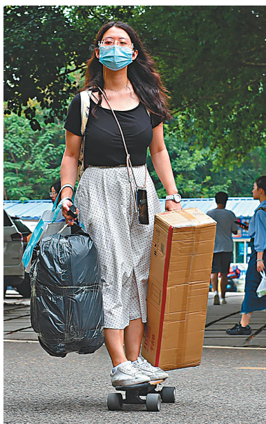
●小貸公司不得將大學生設定爲互聯網消費貸款的目標客戶群體。資料圖片

要嚴格貸前實質審核，實質審核識別大學生身份和真實貸款用途，嚴格落實大學生具備還款能力的第二還款來源(父母、監護人或其他管理人等)，並通過電話等合理方式確認其身份，以及獲取其同意貸款並願意代還的書面擔保材料。