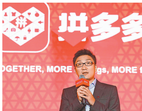
●黃崢稱，辭任董事長後，將結合個人興趣，致力於食品科學和生命科學領域的研究。資料圖片

黃崢認為，行業競爭的日益激烈甚至異化，傳統以規模和效率爲主要導向的競爭有其不可避免的問題，必須在更底層、根本的問題上採取行動，在核心科技和其基礎理論上尋找答案。他舉例了辭任董事長後將長期致力於科研領域，比如通過對農產品種植過程的方法的控制，探索對馬鈴薯、番薯、番茄等的潛在有害重金屬含量進行可靠有效的控制，同時對其可能有的、有益的微量元素進行可控的標準化提升等。