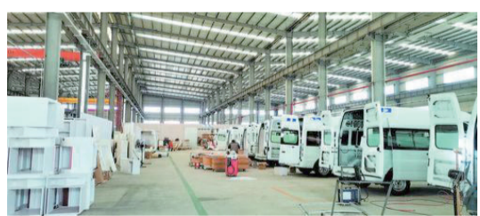
▲廣東來納特種車輛制造有限公司落戶開平，打造特種專用車輛生產基地。

總投資20億元的網驛·江門智造科技港項目，還有燈火匯、索沃思智能終端江門研發製造總部基地、三菱重工空調器整體搬遷及