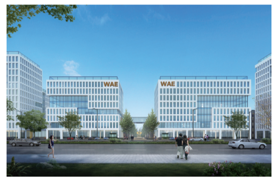
▲網驛 江門智造科技港科技綜合體項目效果圖

蓬江區大健康食品組團項目總投資額20億元，主要由國內知名的食品企業及配套企業組成，包括飲料、面包、方便面、糕點及相關配套產品，計劃建成一個產業鏈齊全、技術先進、環保、衛生、高效的食品產業基地；總投資20億元的網驛·江門智造科技港項目將計劃引進電子信息、物聯網、智能設備製造、精密機電/儀器製造、新材料及與生產