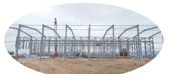
▲威立雅海洋環境工業二期項目主要生產10萬噸級風力發電塔架、鋼管樁、導管架等鋼結構新能源重裝設備，擬打造新能源（江門）裝備製造基地。

壓減至90、55個工作日內，企業開辦時間縮減至1天；“數字政府”建設大步邁進，“即辦率”達97.65%，“時限壓縮率”達95.1%，企業、群眾辦事更便捷。