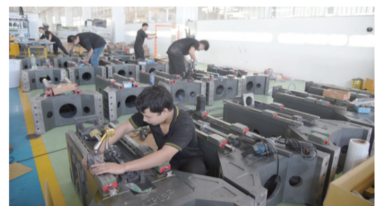
▲艾普升公司落戶恩平後，實現了驚人的發展速度。

心。 “接下來，我局將圍繞廣東省‘雙十’產業集群、市‘5+N’產業集群，聚集融入雙循環發展新格局，加大對粵港澳大灣區、長三角等發達地區招商引資，推動更多高質量的產業項目在我市落地。同時，推動落實新出臺的《關於激勵新投資的實施辦法》，鼓勵引進新投資先進製造業重大項目和產業項目加快開工建設，努力爭取招商引資工作再創佳績，為我市經濟發展在‘十四五’開好局、起好步作出積極貢獻。”趙瑞思說。