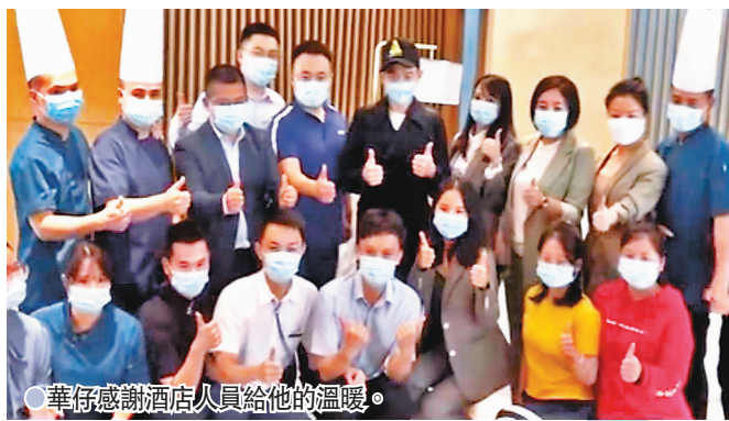
●華仔感謝酒店人員給他的溫暖。

以前曾服用皮膚科藥物，擔心注射新冠疫苗會否跟藥物有衝撞。醫生們都認為視乎是否屬於嚴重過敏，高醫生提醒若過往打疫苗有嚴重反應，最好也是諮詢醫生意見。