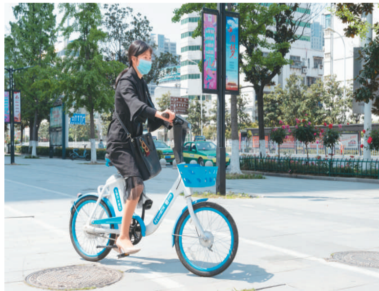
在湖北省襄阳市樊城区，市民正在骑共享电动助力车出行。

对共享经济未来的发展趋势，《报告》持乐观态度，预计2021年共享经济增速将有较大回升，速度有望达到10%—15%，未来五年，年均增速将保持在10%以上。