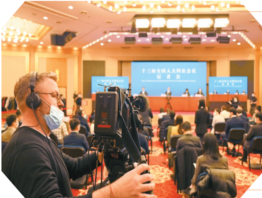
现场。图为十三届全国人大四次会议视频记者会。

新冠肺炎疫情在全球暴发以来，每一位海外同胞的生命安全和身体健康始终是祖国（籍）国的最大牵挂。得知好消息后，多位海外侨胞激动地对本报记者表示，真切感受到中国政府“人民至上”和“外交为民”的大国担当，身为中国侨民感到无比骄傲和自豪！