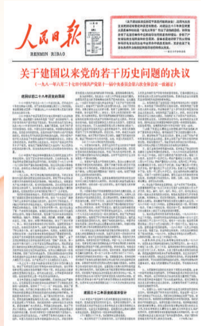
图①：1981年7月1日，《人民日报》刊发《关于建国以来党的若干历史问题的决议》。资料照片