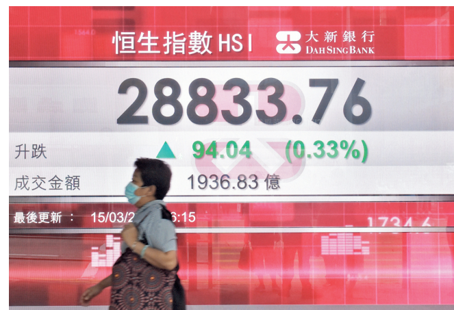
●港股15日持續波動，一度升439點後倒跌，收市回升。中通訊

2月份內地民航旅客運輸量達2,394.8萬人次，同比增1.87倍；當月完成貨郵運輸量更達45.9萬噸，增長55%。數據刺激3隻中資航空股急升，南航升近一成，東航升6.8%，國航亦升6.6%，連帶國泰也跟升2.7%。