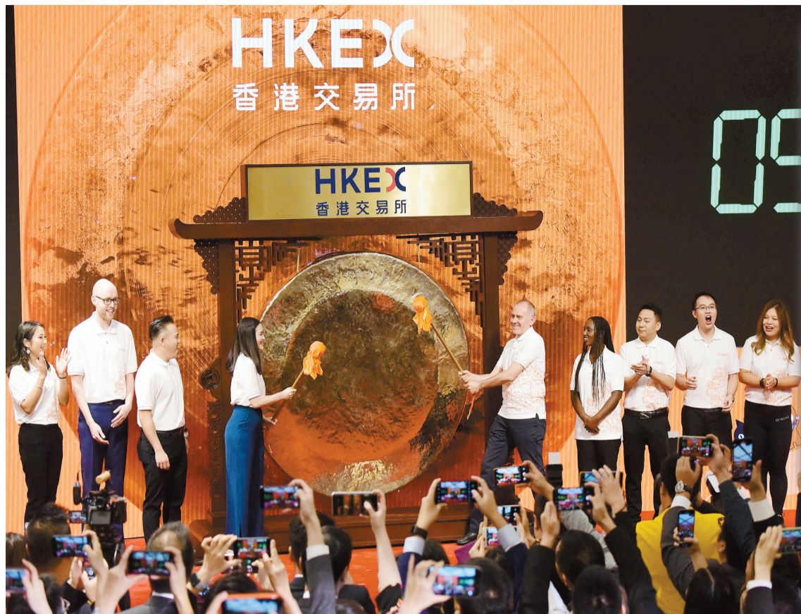
上市委員會去年共審理 151 宗上市申請，雖然較 2019 年大幅減少 23%，但僅拒絕一宗上市申請。資料圖片

【香港商報訊】記者鄭偉軒報道：港交所(388)昨發表的《2020年上市委員會報告》顯示，旗下上市委員會去年共審理151宗上市申請，雖然較2019年大幅減少23%，但僅拒絕一宗上市申請，較2019年的拒絕17宗大幅減少。港交所預計，今年將就檢討海外公司來港上市的機制及股份期權計劃制度開展諮詢，並於最快明年下半年(H2)推出線上服務平台FINI(Fast Interface for New Issuance)，務必把新股結算程序縮短至「T+1」，省卻八成時間。