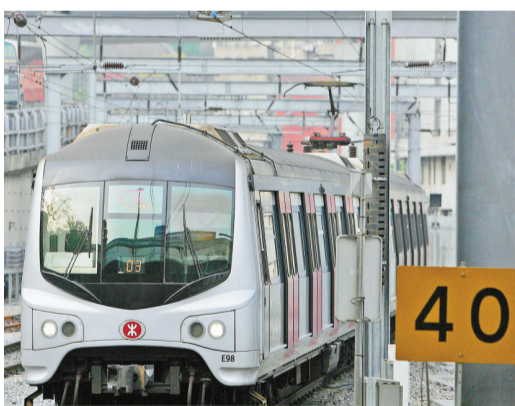
港鐵於今年內推出 4 項目，預期提供 4800 個單位。

【香港商報訊】鐵路物業發展為住宅供應主力之一，港鐵(066)物業及國際業務總監鄧智輝表示，港鐵於今年內推出4項目，預期提供4800個單位。