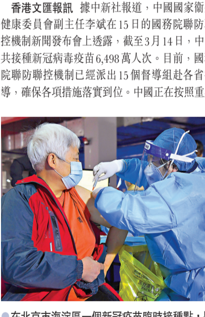
●在北京市海澱區一個新冠疫苗臨時接種點，醫護人員為社區老年人接種。

香港文匯報訊 據中新社報道，中國國家衛生健康委員會副主任李斌在15日的國務院聯防聯控機制新聞發布會上透露，截至3月14日，中國共接種新冠病毒疫苗6,498萬人次。目前，國務院聯防聯控機制已經派出15個督導組赴各省指導，確保各項措施落實到地。中國正在按照重點人群、高危險人群和其他人群依序推進的原則組織實施接種，穩步提高新冠病毒疫苗人群覆蓋率。 高危險人群視安全數據開展 針對老年人、基礎性疾病患者等高危險人群，他表示，目前臨床試驗關於這類人群保護效力的數據還不充分，因此這類人群接種工作需要根據疫苗研發進度來安排，臨床試驗獲得足夠的安全性、有效性數據後將及時開展相關人群的大規模接種。 為保障接種工作的順利開展，李斌說，國務院聯防聯控機制成立了疫苗工作協調組，統籌全國疫苗供應，全力推動疫苗生產擴能。各有關部門加大疫苗供需協調力度，規範疫苗儲存運輸，提高配送效率，保障疫苗供應。各地結合接種人群數量和進度，設置足夠的接種點，配足配齊人員設備。 建全國電子追溯協同平台 同時，嚴格落實疫苗全流程管控措施。在流向追蹤方面，中國建立了全國疫苗電子追溯協同平台，各地及時準確地向平台報告規定信息，做到疫苗全程可追溯，疫苗來源可查、去向可追。在疫苗流通和使用安全管理方面，疾控機構和接種單位嚴把疫苗出入關，定時監測、記錄新冠病毒疫苗在儲存、運輸過程中的溫度，確保儲存安全。