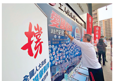
●香港市民簽名支持全國人大通過完善選舉制度的決定。

駱惠寧認為，要深刻理解和完善特區選舉制度，是以對特區選委會重新構建和增加賦權為核心，來進行總體制度設計，完善特區選舉制度是繼國安法出臺後，中央治港的又一重大舉措，相信隨時間推移，其里程碑意義會不斷顯現。他又指，中央對此事非常重視和十分慎重，早前成立工作專辦，在研究過程中也邀請香港從事選舉和法律研究的專家參與，並以多種方式和特區政府、特首溝通，不斷聽取香港社會的意見。