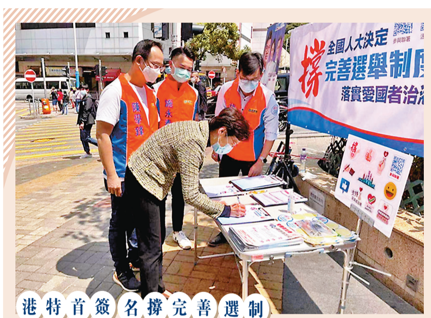
港特首簽名撐完善選制 全國人大日前表決通過關於完善香港選舉制度的決定後，連日來，「香港各界撐全國人大決定完善選舉制度連線」在全港各區擺設街站，收集市民支持人大決定的簽名。香港特區行政長官林鄭月娥15日親身到民建聯位於港鐵堅尼地城站C出口的街站簽名，以行動力撐立法。