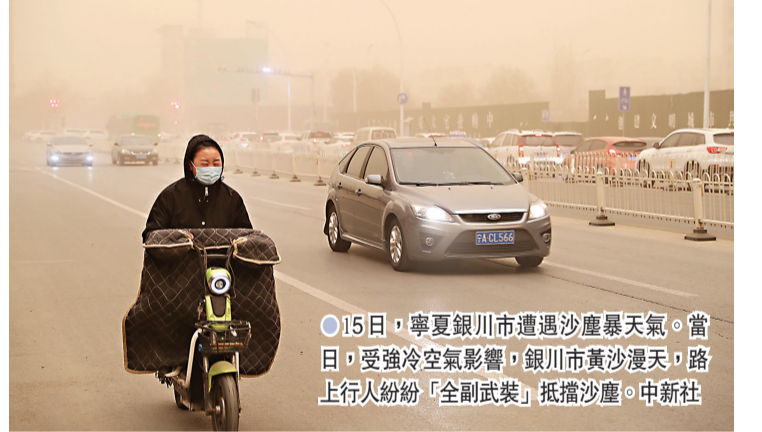
●15日，寧夏銀川市遭遇沙塵暴天氣。當日，受強冷空氣影響，銀川市黃沙漫天，路上行人紛紛「全副武裝」抵擋沙塵。中新社

香港文匯報訊 綜合報道：受近十年來中國最強沙塵天氣突襲影響，15日中國北方多個城市空氣質量出現嚴重污染，北京、張家口、大同、包頭、銀川等多個城市空氣質量指數爆錶。 中國環境監測總站監測顯示，當日7時，北京、天津、大同、呼和浩特、赤峰、鄂爾多斯、銀川、金昌、嘉峪關、武威等多個城市空氣質量出現重度或以上程度污染，北京、張家口、包頭等24個城市空氣質量指數達到或超過500，首要污染物為可吸入顆粒物(PM10)、細顆粒物(PM2.5)。 15日早晨，北京市遭遇「黃沙漫天」，大部分地區PM10濃度超過2,000微克/立方米，大部分地區能見度300-800米。 據中國國家林業和草原局荒漠化監測中心衛星影像和地面監測信息綜合評估，本次沙塵天氣主要起源於蒙古國。14日上午，蒙古國西南部發生沙塵暴天氣，沙塵隨氣流向南移動。 被問到防護林為何沒有發揮作用？中國氣象局環境氣象中心主任張碧輝說，這主要是由於前期蒙古國及中國西北地區氣溫偏高，同時氣候乾燥，又受到較強蒙古氣旋的影響，為沙塵暴天氣創造了有利的熱力和動力條件。他表示，防護林主要是近地面的，地表植被的變化對整個風場的影響非常有限，相對於此次非常強的天氣過程來說，防護林的影響能力非常低。 蒙古國已致6死81人仍失蹤 蒙古國國家緊急情況總局發布消息說，從13日晚至15日上午9時，在全國範圍內共收到9省548名牧民在沙塵暴中失蹤的報告，其中467人已被找到，中戈壁省5名牧民和後杭愛省1名五歲孩子不幸死亡。目前緊急情況部門正在組織人員，繼續尋找81名失蹤牧民。