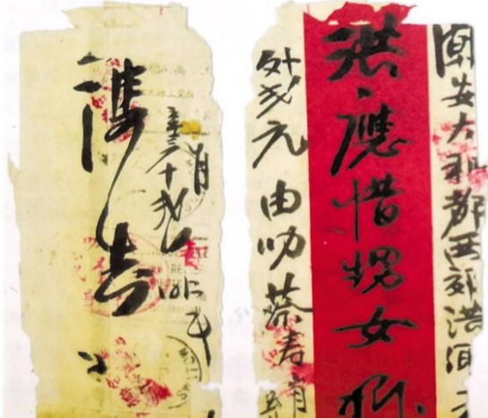
20世紀20年代陳來鎮寄潮安秋溪陳宅母親的“紅條封”

形式各異 信封圖案留存時代印記 僑批產生於民間,流轉於民間,收藏於民間。早期的僑批較為簡單,有單獨一張信紙自制成“折疊封”,也有傳統“紅條封”。信紙大多為普通紙張,大小不等、規格各異。隨著海外華僑的數量增多,華僑與家鄉聯系的願望日益強烈,僑批封形式、外觀有了變化,不僅題材豐富,制作也十分精美。